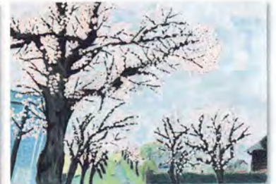
令和5年度 最優秀作品