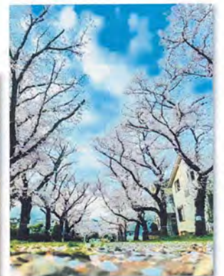
令和5年度 最優秀作品